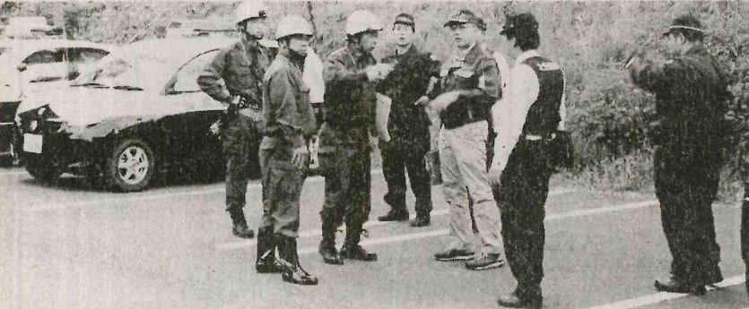
消防団員は、消防活動に備える。訓練内容は、火災発生時の対応、消火活動、救助活動など。消防団員は、消防活動に備える。訓練内容は、火災発生時の対応、消火活動、救助活動など。