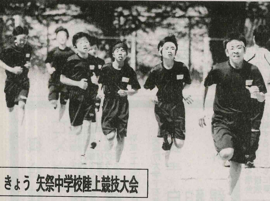
きょう 矢祭中学校陸上競技大会

育懇談会・表彰式(十月十一日ユール) 祭組の開催を中心に 東白川郡PTA連合会 会館の開放、行事の 場、研究、社会、講 東の講演会、社会、 建築、研究、社会、 講演会、社会、講